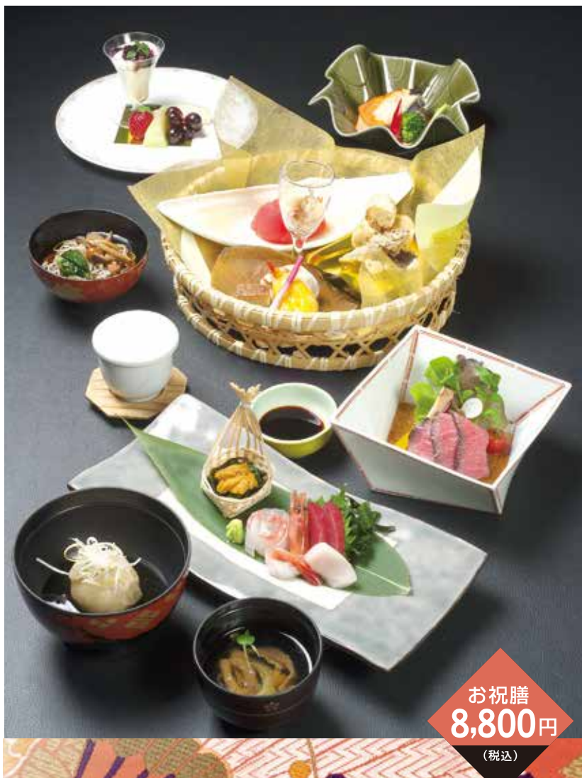
お祝膳 8,800円 (税込)