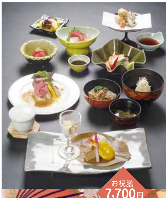
お祝膳 7,700円 (税込)