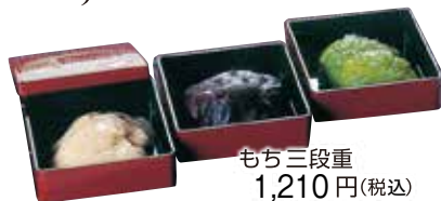
もち三段重 1,210円(税込)

プラザイン水沢では 様々なお慶びのシーンを ホテルならではのおいしさと 真心でお手伝いをさせて いただきます 人数にご予算に応じて承ります