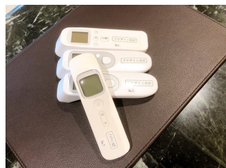
非接触体温計の貸し出し ※数に限りがございます