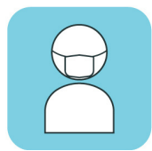
スタッフのマスク着用

プラザイン水沢では、スタッフの手指の消毒・マスク着用・検温を行うほか、お客さまに安心してホテルをご利用いただけますよう、以下の対策に取り組んでおります。