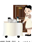
料理提供と下げ皿を別にしていきます。