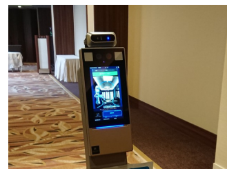
体温スクリーニング用 サーモカメラ導入