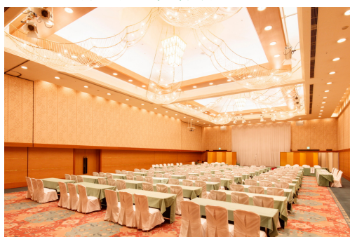
写真は新生活スタイル前のレイアウト

※換気回数とは、1時間あたり会場内すべての空気を入れ替える回数です。また、会場内の二酸化炭素濃度については、1,000ppmを下回る設計になっており、定期的に二酸化濃度測定器を使用し測定しております