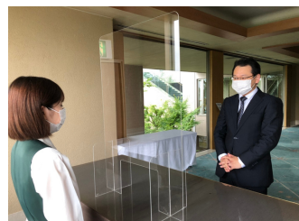
受付・演台などにはアクリルパネルを設置