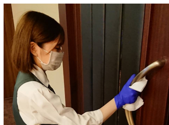
お客様が触れる機会が多い箇所の消毒