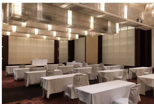
写真は新生活スタイルのレイアウト

換気回数：1時間あたり約3.1回（約20分に1回の入れ替え） 新生活様式スタイルにより、着席にて156名の収容にしておりますので、 推奨換気量の約2倍以上の換気量がございます。