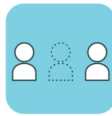
他のお客様と距離を保った会場レイアウト