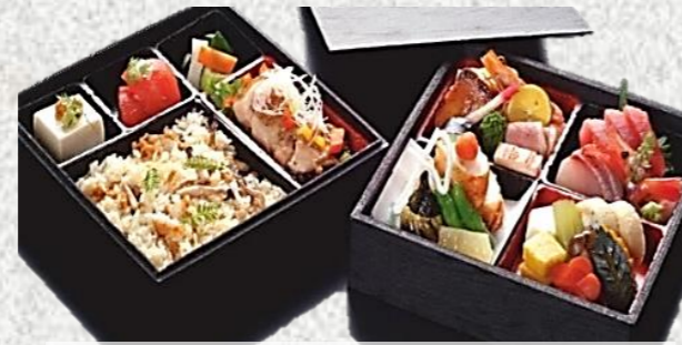
きくすい弁当 (松) 3,888 円税込 (3日前ご予約商品)