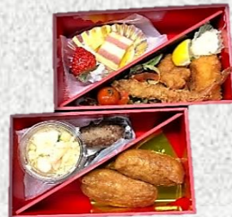
お子様弁当 1,620 円税込 (3日前ご予約商品)