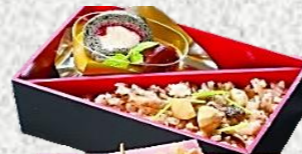
きくすい弁当 (梅) 1,728 円税込 (3日前ご予約商品)