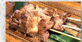
・前沢牛串焼き (3本)