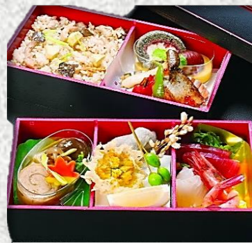
きくすい弁当 (竹) 2,484 円税込 (3日前ご予約商品)