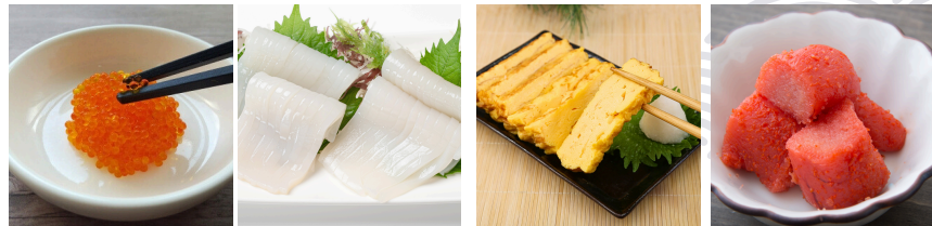
※写真は一例です。市場の関係により具材内容を変更する事がございます。