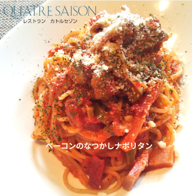
ベーコンのなつかしナポリタン