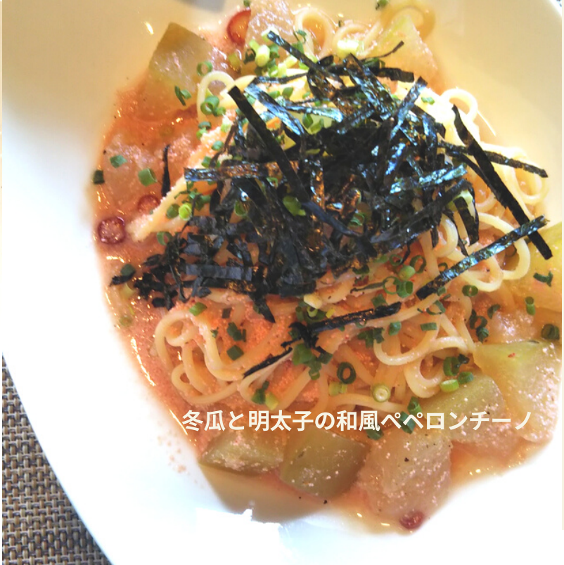
冬瓜と明太子の和風ペペロンチーノ