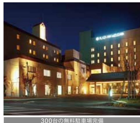
300台の無料駐車場完備